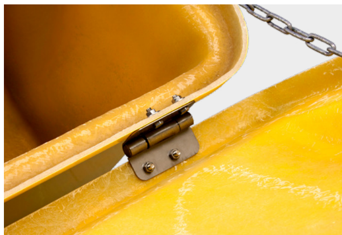
detail nerezového pantu