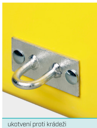
ukotvení proti krádeži